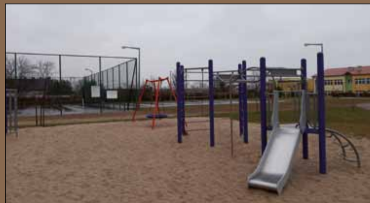
Na zdjęciu: plac zabaw w Męcince

W tym roku nowoczesne place zabaw powstaną w Chełmcu, Chroślicach, Małuszowie, Piotrowicach oraz przy przedszkolu w Męcince. Obecnie trwają prace projektowe dotyczące zagospodarowania terenu oraz montażu nowych urządzeń zabawowych dla dzieci. Celem podjętych działań jest wyposażenie każdego sołectwa w Gminie Męcinka w nowoczesny plac zabaw. W ubiegłym roku dzięki pozyskanej dotacji place takie powstały w Przybyłowicach, Pomocnem oraz przy szkole w Męcince. Niebawem przystąpimy do projektowania placów w kolejnych miejscowościach.